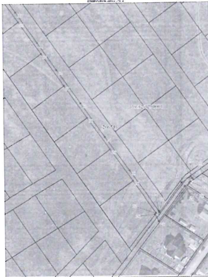
Водоотвод № 2

Условные обозначения представлены на листе 4